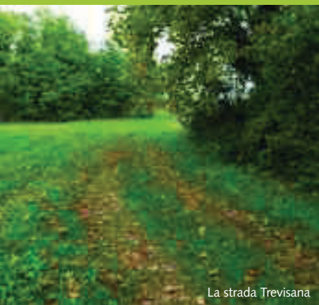
La strada Trevisana