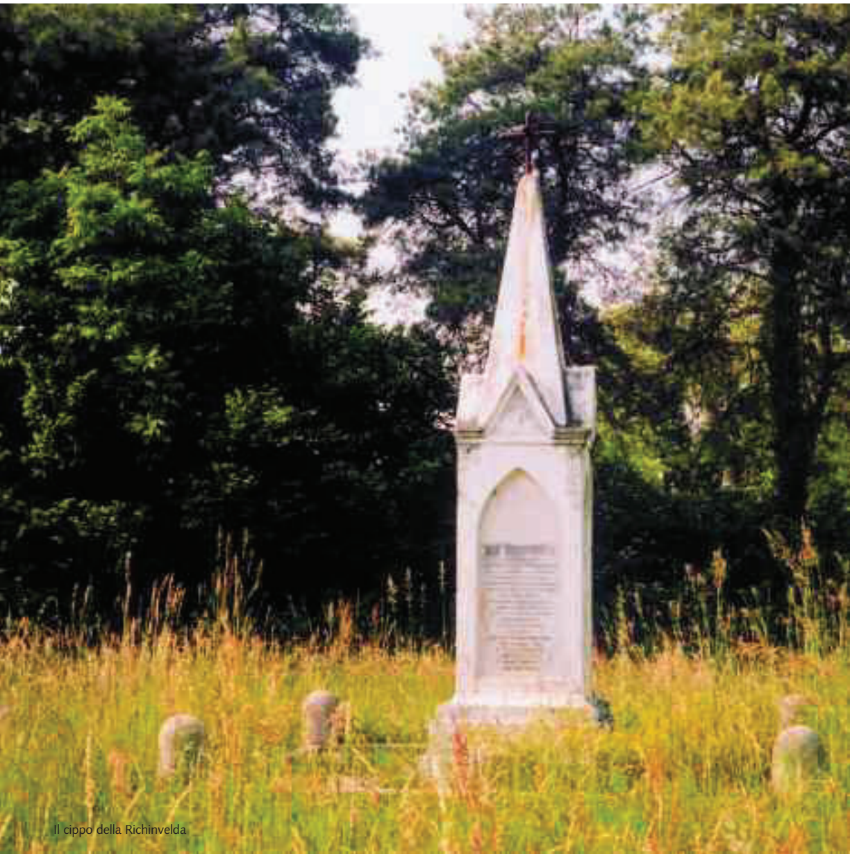
Il cippo della Richinvelda