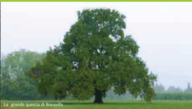
La grande quercia di Bonavilla