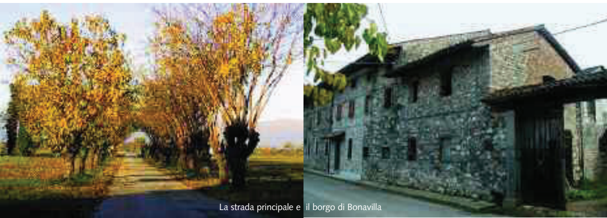
La strada principale e il borgo di Bonavilla

Il restauro sponsorizzato da Italia Nostra vuole essere un riconoscimento per quanto è stato fatto finora per la tutela di questo ambiente e un incentivo alla promozione di iniziative che ne valorizzino gli aspetti peculiari consentendone la corretta conservazione.