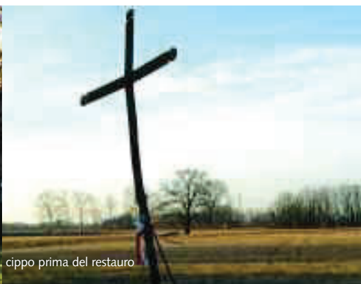
La strada d'ingresso a Bonavilla e il cippo prima del restauro